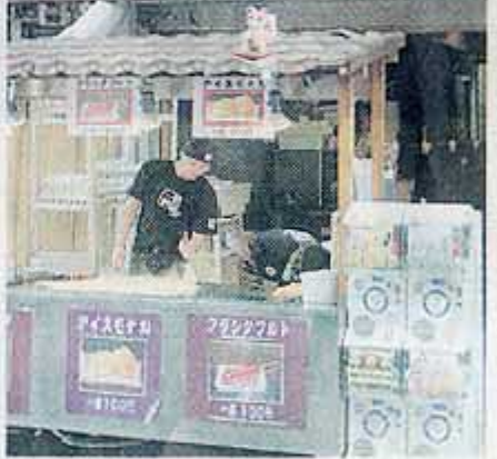
商店街を中心に出店する「一銭屋本家」(大阪・北区)